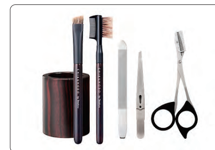
SH-9 メンズグルーミングセットA